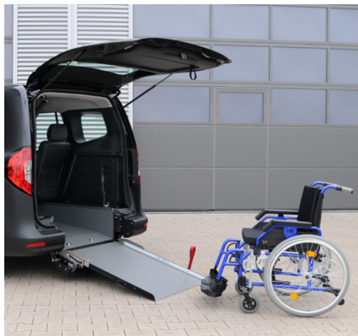
Bei ausgeklappter Rampe lässt sich das Fahrzeug bequem mit dem Rollstuhl befahren.

Mercedes-Benz Citan / T-Klasse Lang (Fahrzeuglänge: 4,5 m)